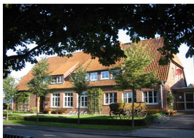
Heimathaus „Alte Schule“

Einzelvertretungsberechtigter Vorstand gem. § 26 BGB: